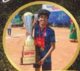
Levin Dsa Chalalasta ward

For winning inter college independence day Championship Football Trophy 2024