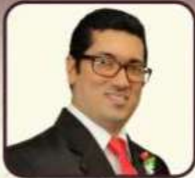
AEREN LOBO Wedding Planner / Event Management