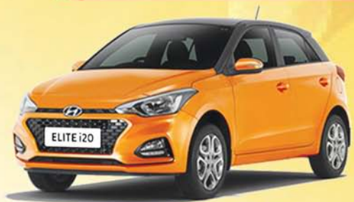
The New 2018 ELITE i20