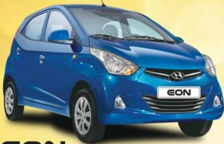
EON VALUE KA NAYA TREND