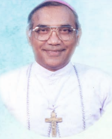
ಅ ಮಾ ದೊ ಲುವಿಸ್ ಪಾವ್ ಸೊಜ್

ಪಾಟ್ಲ್ಯಾ 22 ವರಾಂನಿ ಮಂಗ್ಳುರ್ ದಿಯೆಸೆಜೆಚೊ ಗೊವ್ಳಿ ಜಾವ್ನ್ ತುಮಿ ದಿಲ್ಲ್ಯೆ ನಿಸ್ತಾರ್ಥ್ ಸೆವೆಕ್ ಅಭಾರ್ ಮಾಂದ್ತಾವ್. ತುಮ್ಮಿ ಮುಕ್ತಿ ಜಿಣಿ ಭಲಾಯ್ಕೆ ಭರಿತ್ ಸುಖ್ ಸಮಾಧಾನಾಚಿ ಜಾಂವ್ಪಿ ಮ್ಹಣ್ ಮಾಗ್ತಾವ್