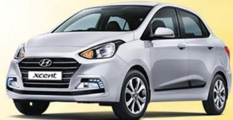
ALL NEW XCENT