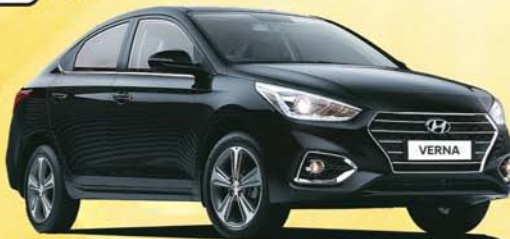
The Next Gen VERNA