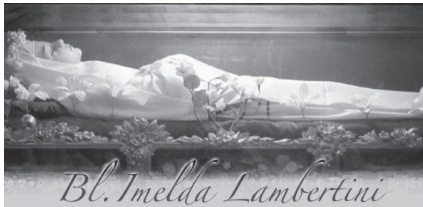
Bl. Imelda Lambertini