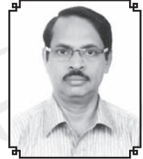
ಶ್ರೀ ಸ್ವಾನ್ವಿ ಫ್ರಾನ್ಸಿಸ್ ಬಾರೆಟ್ಟೊ ಮದರ್ ತೆರೆಜಾ ವಾಡೊ

2019, ಜೂನ್ ಮಹಿನ್ಯಾಚ್ಯಾ 14 ತಾರಿಕೆರ್ ಭರ್ಲೊ ಹುರುಪ್ ಮಿಲಾರ್ ಫಿರ್ಗಜೆಚೆಂ ಬದ್ಲಂಕ್ ಲಾಗ್ಲೆಂ ಸುರುಪ್ ಜಾಲಾ ಸಂತೊಸ್ ಆಮ್ಕಾಂ ಸರ್ವ್ ಮಿಲಾರ್‌ಗಾರಾಂಕ್ ಉಲ್ಲಾಸ್ ಜಾಲಾ ಆಮ್ಚ್ಯಾ ಪಾತ್ಸೊನ್ ಮರಿಯೆ ಮಾಯೆಕ್ ಅರ್ಗಾಂ ದಿವ್ಯಾ ಕಾಳ್ಜಾಂ ಥಾವ್ನ್ ಧನ್ಯಾ ದೆವಾಕ್ ಎದೊಳ್ ಪರ್ಯಾಂತ್ ಆದ್ಲ್ಯಾ ವಿಗಾರಾಕ್ ಸಾಂಬಾಳ್ನ್ ವೆಲ್ಲಾಕ್ ಯೆವ್ಕಾರ್ ಮಾಗ್ತಾಂವ್ ನವೊ ವಿಗಾರ್ ಮಾ ಜೊಸ್ಸಿ ಬಾಪಾಂಕ್ ದೆಂವೊಂ ಆಶೀರ್ವಾದಾಂ, ಲಾಬೊಂ ಸೆವಾ ಮಿಲಾರ್ ಫಿರ್ಗಜೆಕ್ ಸ್ವಾಗತ್ ಸ್ವಾಗತ್ ಮ್ಹಣ್ತಾ ಫಿರ್ಗಜೆ ಮಿಲಾರ್ ಜಾವ್ನ್ ಆಯಿಲ್ಲಾಕ್ ಜೋಸೆಫ್ ಬಾಪ್ ವಿಗಾರ್