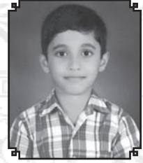
✍ Rishon Valdard St Francis Xavier Ward